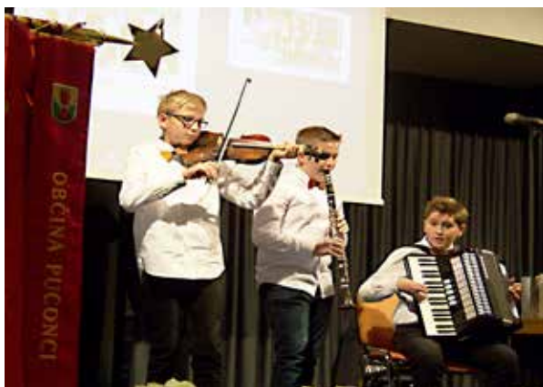
Naša glasbena prihodnost

Vsem, ki so kakorkoli razumeli vsebino koncerta in nam priskočili na pomoč, naj velja iskrena domoljubna hvala ter zahvala. Zahvala velja vsem razumevajočim in dobrosrčnim domoljubnim: izvajalcem, vsem donatorjem, našim članicam in članom, ki so pripravili okusne dobrote, ter vsem, ki so nam kakorkoli pomagali pri izvedbi tako zahtevnega vsebinskega projekta. Zaradi mnogo izra-