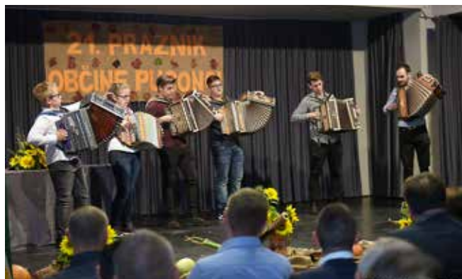
Slavnostna seja Občinskega sveta Občine Puconci