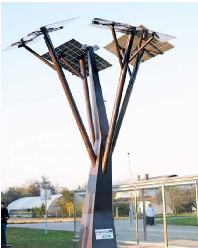
Otvoritev solarnega drevesa pri OŠ Puconci