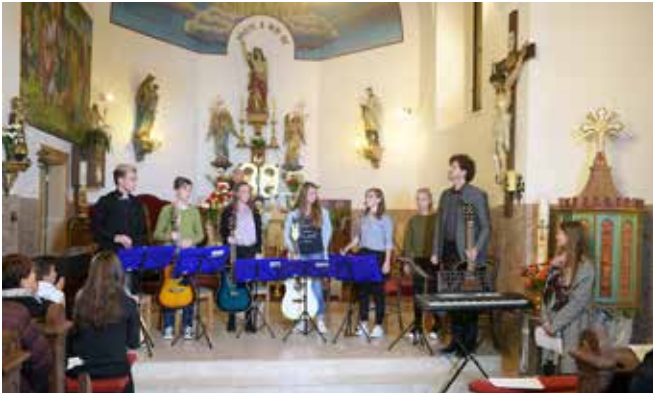
Revija cerkvenih pevskih zborov v Pečarovcih