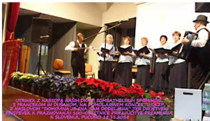
Utrinek s koncerta, foto: Jože Časar