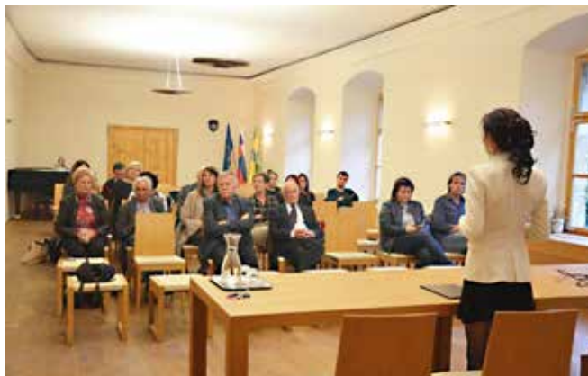
Večer pripovedovanja v okviru DEKD