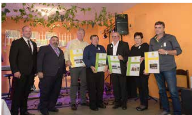
Osrednja prireditev ZKTD Občine Puconci v Dolini