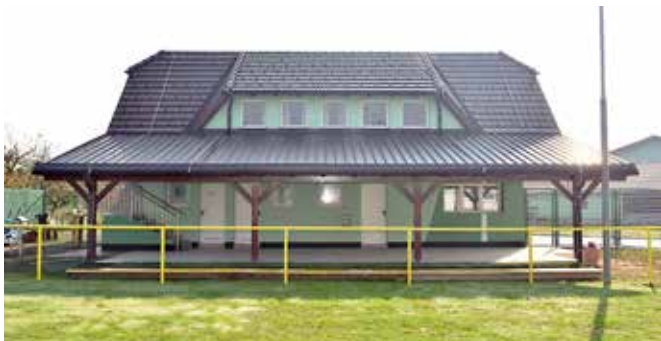
Končna podoba športnega objekta

Med lastna sredstva se štejejo privarčevana sredstva, prostovoljni prispevki vaščanov, prihodki od prodaje starega železa (tri leta zapored smo po domačijah zbirali staro železo), prihodki od prireditev in pridobljena sponzorska sredstva.