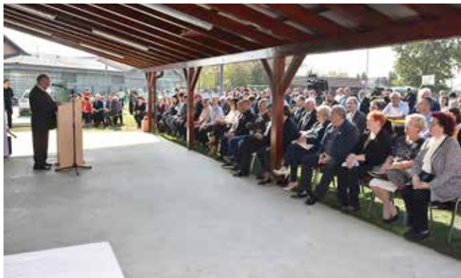
Svečanost v Brezovcih

Prva naloga gradbenega odbora je bila priprava finančne konstrukcije in v povezavi s tem načrtovanje dinamike izgradnje. Po popisu del smo pridobili predračun, ki je skupaj z DDV znašal dobrih 150 tisoč evrov.