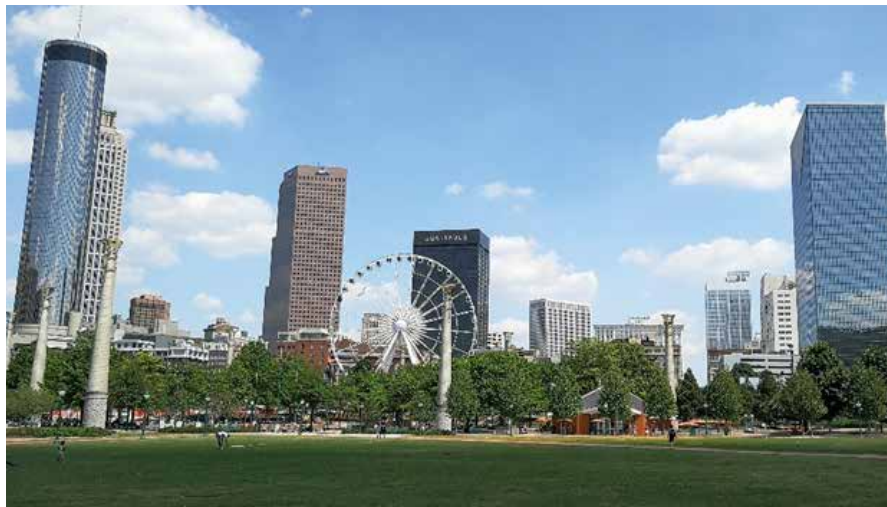
Centralni park v središču Atlante z mogočnimi stolpniciami v ozadju.

Je pa moja pričakovanja presegló mesto, ki je dalo kar nekaj pomembnih osebnosti in zgodovinskih mejnikov. Med najpomembnejšimi je zagotovo Coca-Cola, pijača in blagovna znamka, ki je simbol globalizacije današnjega sveta. Skrivnostni recept je leta 1886 pripravil farmacevt John S. Pemberton. V svoji lekarni je v tistih časih poleg zdravil pripravljaval tudi številne osvežilne napitke, med katerimi se je najbolj prijela Coca-Cola. Glas o neverjetni pijači se je hitro širil po deželi in pritegnil pozornost številnih, po denarju hrepenečih, podjetnikov in bankirjev. Kot že mnogokrat doslej, tudi v tej zgodbi, najbolj zaslužen ni imel prav posebnih koristi od tega. Nedaleč stran od kipa Pembertona stoji center človekovih pravic, ki je deloma tudi muzej. Največ zaslug za to ima sociolog in doktor teologije afro-ameriških korenin, Martin Luther King. Konec 50-tih in v začetku 60-tih se je boril za pravice temnopoltih rojakov, v takrat še rasno zelo nestrpni Ameriki. Občudovanje in spoštovanje množic si je pridobil s svojimi neverjetnimi retoričnimi sposobnostmi, prizadevanjem za odpravo neenakosti na miren način. Za to je prejel tudi Nobelovo nagrado.