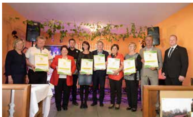
Osrednja prireditev ZKTD Občine Puconci v Dolini