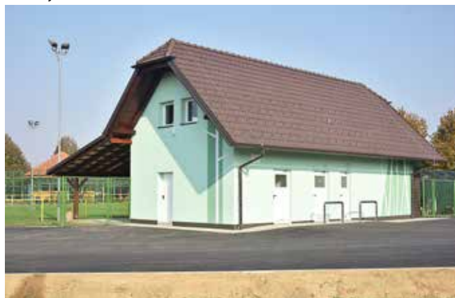
Športni objekt in urejen dovoz