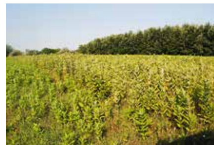
Naj se zgodba iz južne Madžarske ne ponovi tudi pri nas.