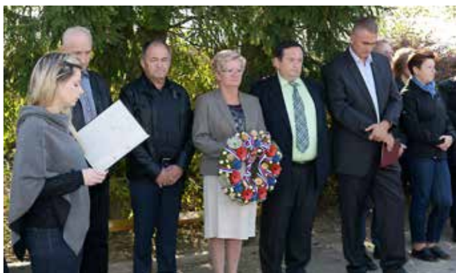
Položitev venca pri spomeniku Števana Küzmiča v Strukovcih