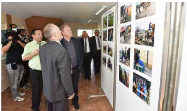
Razstava o poteku izgradnje objekta