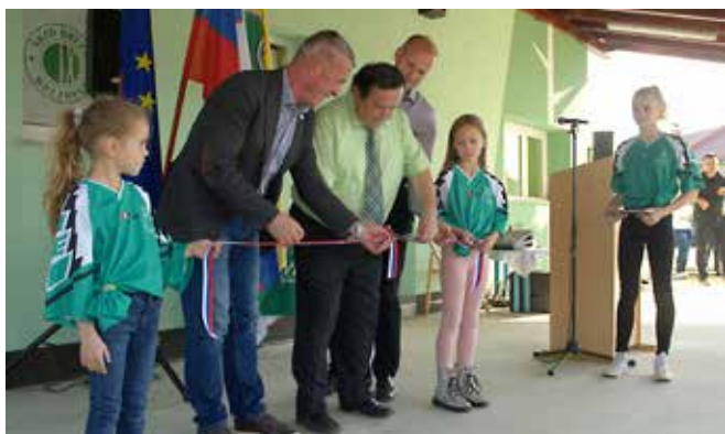
Otvoritev investicijskih pridobitev v Brezovcih