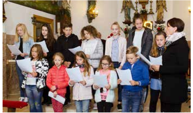
Revija cerkvenih pevskih zborov v Pečarovcih