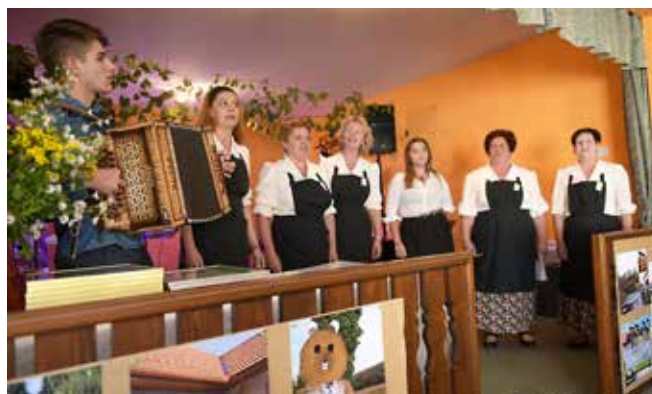
Osrednja prireditev ZKTD Občine Puconci v Dolini