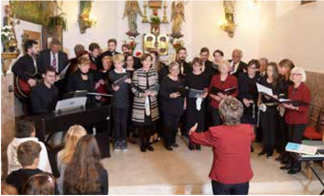
Revija cerkvenih pevskih zborov v Pečarovcih