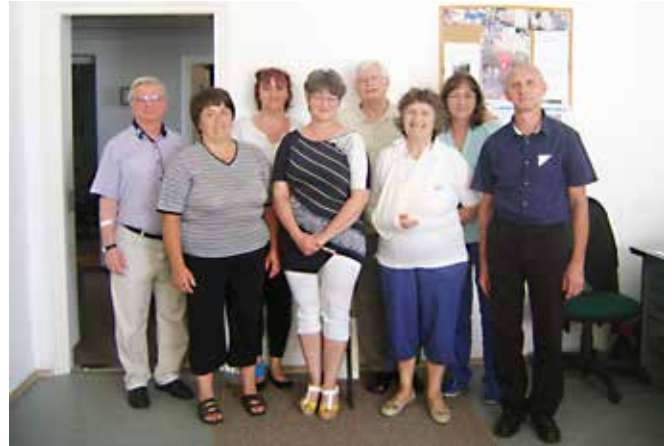
Del kolektiva Radia Monošter z našo delegacijo dne 10. 9. 2018

Program Radija Monošter lahko spremljamo v živo na spletnem naslovu www.radiomonoster.hu , le klikniti je treba na ikono „V ŽIVO“. Program daje možnost poslušanja oddaj za nazaj. Dogovorili smo se tudi o nadaljnjem sodelovanju na področju domoljubja in spoštovanja plemenitih in nacionalnih vrednot, ki so nas Slovence spremljale v vsej naši zgodovini in naprej, tudi z ohranjanjem lepe »porabsčine«. Sodelovanje bo slonelo na medsebojnem informiranju s slovensko samoupravo, posebej v Szombathelyu in Szombathelyskimi spominčicami ter drugimi v Porabju.