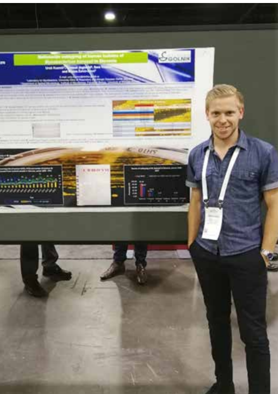
Prestavitev posterja na kongresu.

prav tako pomembno, pripravljali so dobre zajtrke. V deželi »fast food-a« in »food porn-a« si seveda vesel, če lahko poješ še nekaj, kar ni ocvrto ali predvsem, pretirano sladko. Razlogi za take prehranjevalne navade segajo v 60. in 70. leta prejšnjega stoletja. Takrat so ameriški znanstveniki ugotovili, da so za »epidemijo« debelosti, ki povzroča srčno-žilna obolenja, odgovorne predvsem maščobe. Osredotočali so se namreč le na škodljivi LDL holesterol. Ker so maščobe razglasili za grešnega kozla, so jih začeli nadomeščati s sladkorji, predvsem fruktozo, ki so jo množično dodajali predelani hrani. Danes vemo, da je razlog za debelost veliko bolj sladek kot masten. Kljub temu Američani še vedno uživajo presladko hrano. Debelost ostaja množičen problem, razlika je le, da se ji je pridružila še sladkorna bolezen, kuga sodobnega časa.