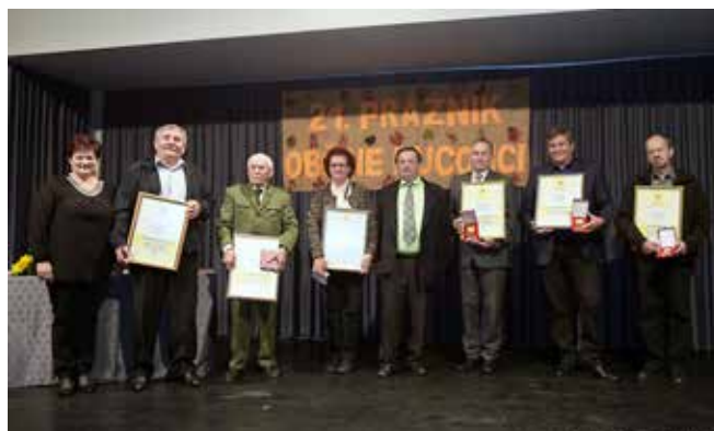
Slavnostna seja Občinskega sveta Občine Puconci – nagrajenci občine