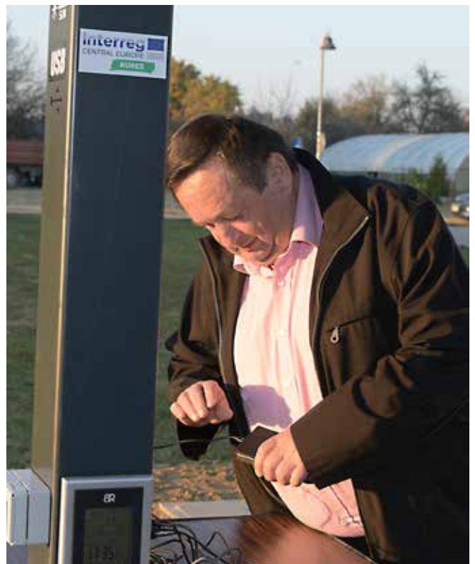
Otvoritev solarnega drevesa pri OŠ Puconci