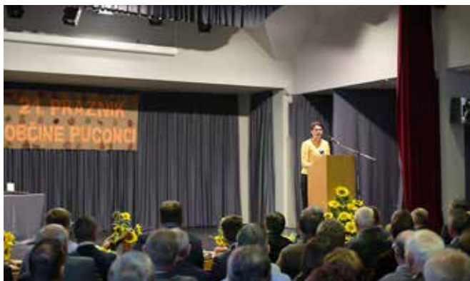
Slavnostna seja Občinskega sveta Občine Puconci