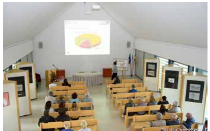
Predavanje v Spominskem domu Števana Kuzmič