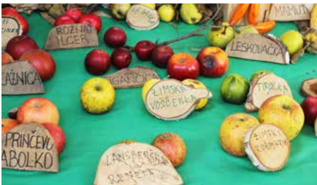
Plodovi iz travniških sadovnjakov so bili tudi letos lično izloženi.