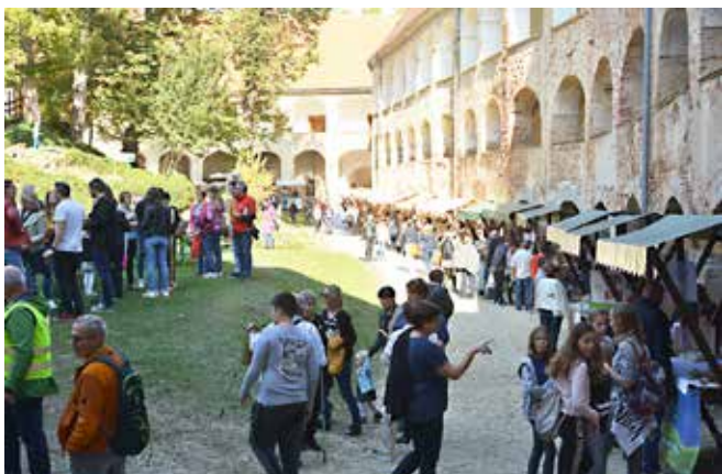
Sejemski utrip na grajskem bazarju

13. oktobra smo na gradu Grad organizirali že 13. Grajski bazar. Na 33 stojnicah je 34 rokodelcev in ponudnikov domačih pridelkov, izdelkov in produktov ponujalo marsikaj in pestrega dogajanja prav tako ni manjkalo. Otroci so si lahko ogledali predstavo Obuti maček, se brezplačno zapeljali s cestnim turističnim vlakcem po okolici gradu, se zabavali na grajski terasi ob igrah