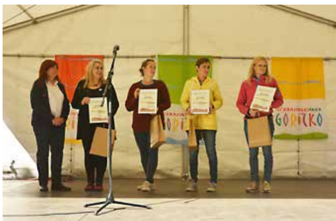
Prejemniki pravice do uporabe Kolektivne blagovne znamke KPG